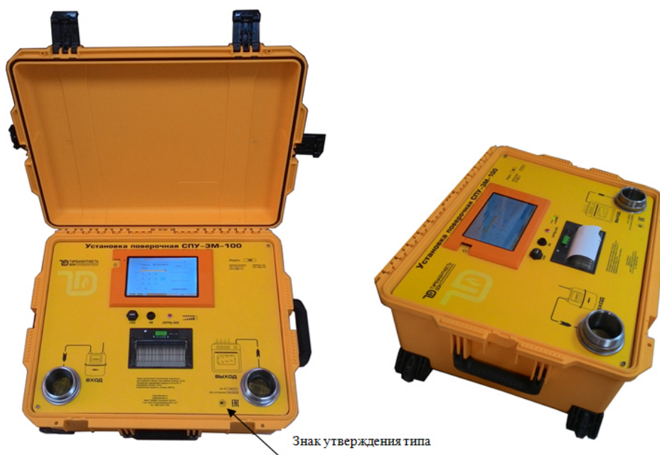
Рисунок 1 – Общий вид установок поверочных СПУ-3М-100

Пломбирование установок поверочных СПУ-3М-100 и обозначение мест для нанесения поверительных клейм в целях предотвращения несанкционированной настройки и вмешательства осуществляется в соответствии со схемой на рисунке 2.